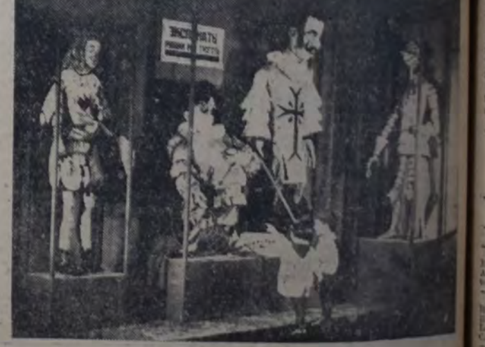
UNA ESCENA DEL FILM "PRINZ"

¿Cómo? ¿Y el Japón de que tanto nos habla? ¿Y la América del sur? ¿España? ¿E Italia e Inglaterra? Tal-