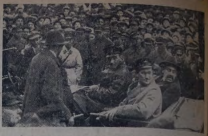
LLEGADA A MOSCU DE LOS HEROES DEL "KRASSIN"