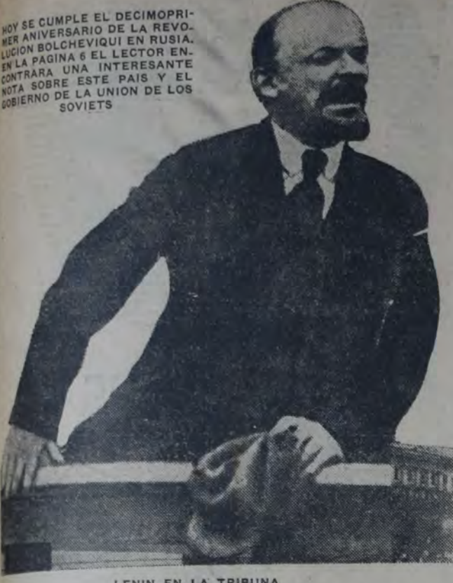
LENIN EN LA TRIBUNA

HOY SE CUMPLE EL DECIMOPRIMER ANIVERSARIO DE LA REVOLUCION BOLCHEVIQUI EN RUSIA. EN LA PAGINA 6 EL LECTOR ENCONTRARA UNA INTERESANTE NOTA SOBRE ESTE PAIS Y EL GOBIERNO DE LA UNION DE LOS SOVIETS