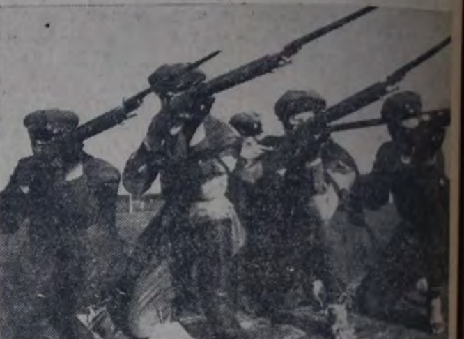
EN ESTOS SOLDADOS DEL EJERCITO BLANCO Y EN SU BUENA PUNTERIA ESTUVO DEPOSITADA LA ESPERANZA DE LOS ENEMIGOS DEL SOVIET.