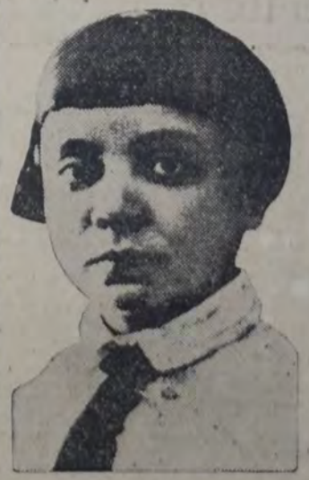
LA ESCRITORA GFULINA, autora de novelas.

El poder de los Soviets vela porque el arrendatario observe el contrato, ceda también de que el contrato sea beneficioso para el estado soviético y de que se mejore la situación de los obreros campesinos. Bajo estas condiciones no es peligroso el fomento del capitalismo, y el provecho de los obreros y campesinos está en el aumento de los productos." (Discurso de Lenin pronunciado el 25 de abril de 1924, cuya versión impresionada en gramófono se publicó en el diario oficial "Izvestia").