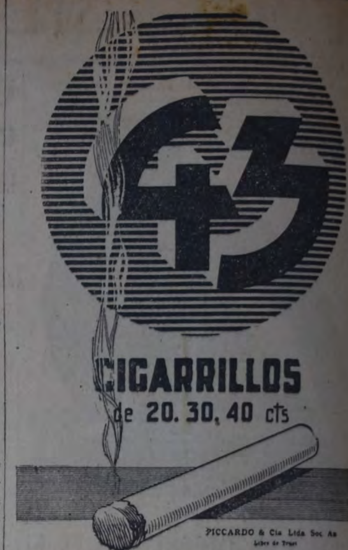
PICCARDO & Cia. Lda. Soc. An. Libros de Tramp

Por ejemplo: el artículo 13 del escalafón anterior se limitaba a decir que toda solicitud o reclamación del personal debía ser presentada por escrito y por intermedio del jefe inmediato. A este se le ha agregado que si dentro del término de diez días el interesado no recibiera una contestación satisfactoria, el asunto será tratado por una comisión compuesta de tres miembros, incluso el afectado, ante el superintendente o inspector del tráfico, según el caso; y si esto no diera resultado, se pasará el asunto a la comisión central