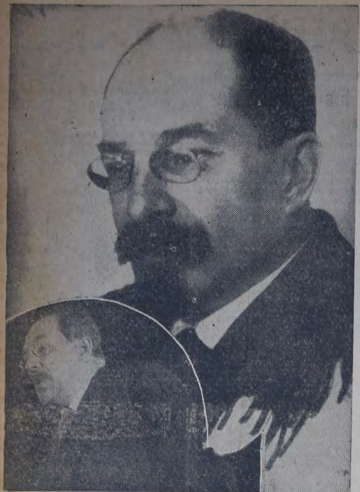
LUNATSCHARKI, PRIMER MINISTRO DE INSTRUCCION PUBLICA DEL Soviet. Abajo: Dirigiéndose al pueblo en un mitin.