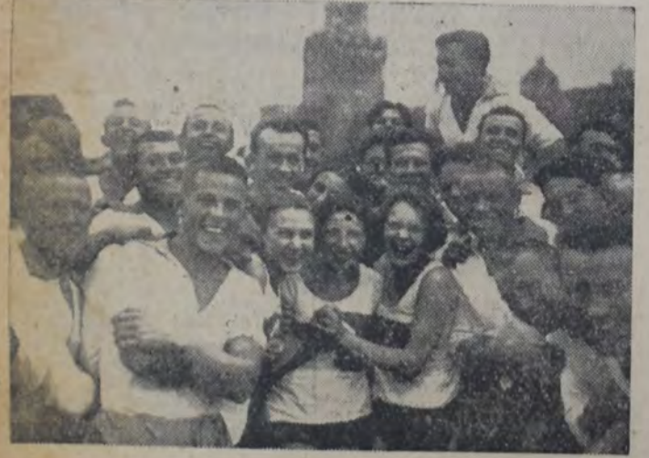
300,000 PARTICIPANTES EN UN D ESFILE DE ORGANIZACIONES DEPORTIVAS.

He aquí algo claro. No es posible considerar de una manera más nítida al comunismo como la prolongación y la realización, por fin completa, de la democracia. "El comunismo — dice también Barbusse textualmente —, no tiende al triunfo de una clase sobre otra, a las represalias de los oprimidos, sino que su meta final es la supresión de las clases y la implantación de un estado de interés general".